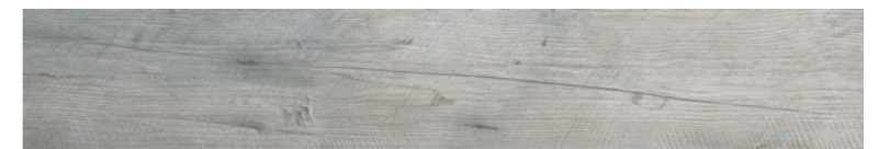
OREGON GREY WOOD Code: ORE-GR-WD Size: 7.9x47.2"