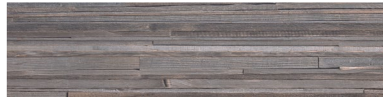
OREGON AGATA DECO Code: ORE-AGT-DEC Size: 11.8x47.2"