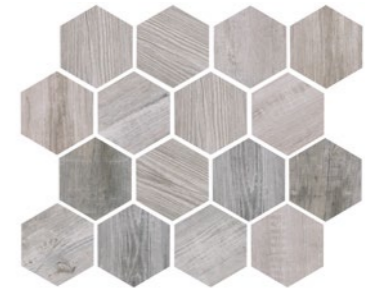
OREGON RUSTIC BIANCO HEX Code: ORE-RUS-BIA-HEX Size: 9.8x11.8"