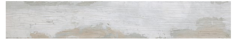
OREGON WHITE WOOD Code: ORE-WHT-WD-848 Size: 7.9x47.2"