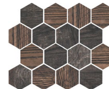
OREGON FUME HEX Code: ORE-FUM-HEX Size: 9.8x11.8"