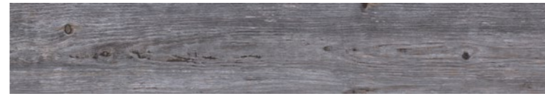
OREGON AGATA Code: ORE-AGT-848 Size: 7.9x47.2"