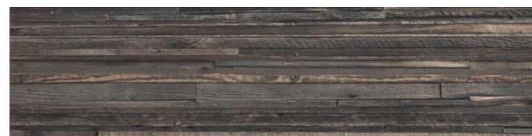
OREGON FUME DECO Code: ORE-FUM-DEC Size: 11.8x47.2"