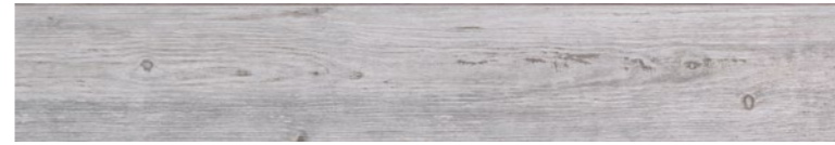
OREGON RUSTIC BIANCO Code: ORE-RUS-BIA-848 Size: 7.9x47.2"