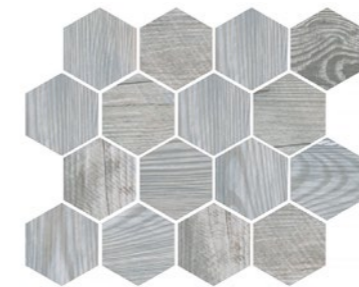
OREGON GREY WOOD HEX Code: ORE-GR-WD-HEX Size: 9.8x11.8"