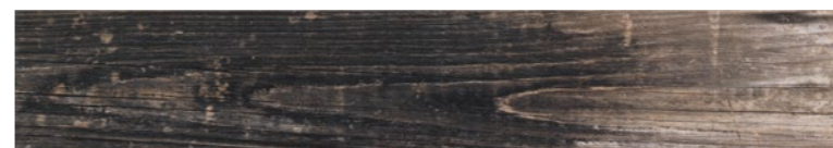
OREGON FUME Code: ORE-FUM-848 Size: 7.9x47.2"