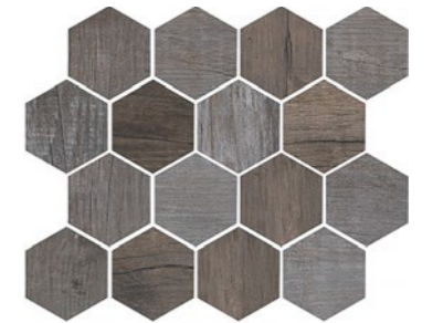
OREGON AGATA HEX Code: ORE-AGT-HEX Size: 9.8x11.8"