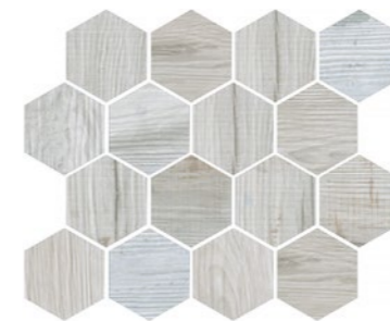
OREGON WHITE WOOD HEX Code: ORE-WHT-WD-HEX Size: 9.8x11.8"