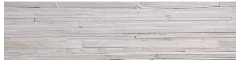
OREGON RUSTIC BIANCO DECO Code: ORE-RUS-BIA-DEC Size: 11.8x47.2"