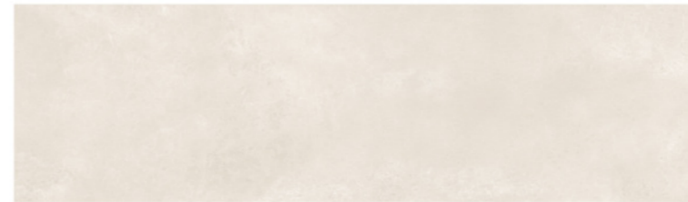
AURORA WHITE 1240 Size: 11.4X39.3"