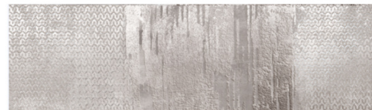
AURORA GREY DECO 1240 C Size: 11.4X39.3"