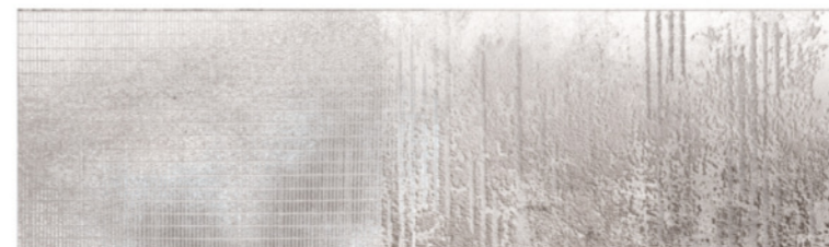
AURORA GREY DECO 1240 B Size: 11.4X39.3"