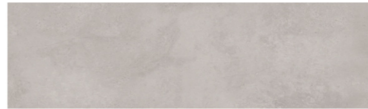
AURORA GREY 1240 Size: 11.4X39.3"