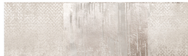
AURORA WHITE DECO 1240 C Size: 11.4X39.3"